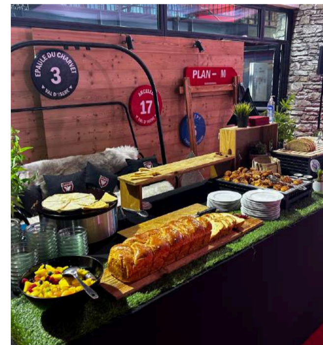
BRUNCH DU CRIT'