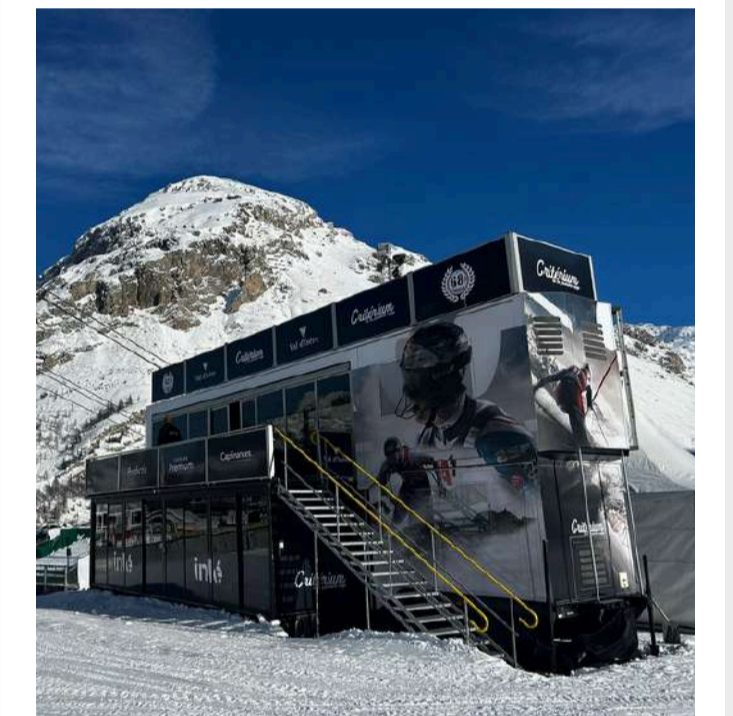
LES ESPACES PRIVATIFS